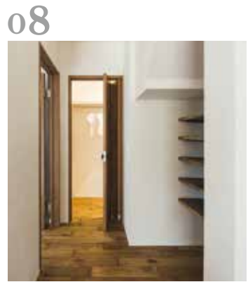
08 美しい生活動線 昔ながらの田の字プランも、暮らしやすく動きやすい、実用的で美しい生活動線にリノベーション。