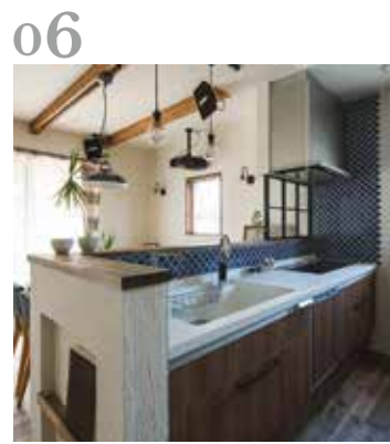
06 キッチン 奥様お気に入りのキッチンは、シックで飽きのこないモザイクタイルをあしらった大人っぽく仕上がりました。