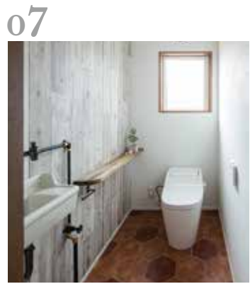
07 トイレ 板壁風のクロスとテラコッタ風のクッションフロアがナチュラルでかわいい雰囲気トイレ。