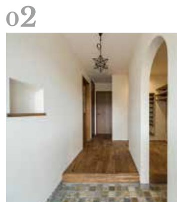
02 玄関ホール 石畳のような土間とアーチ壁がかわいい玄関ホール。アーチをくぐるとシューズクロークになっています。