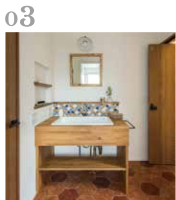
03 造作洗面化粧台 オープンな造作洗面台にモザイクタイル「コラベル」がアクセントとなり、レトロなデザインになりました。