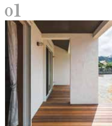
01 ウッドデッキ リビングから段差なく繋がるウッドデッキはお施主様の手作り。プロさながらの出来栄です。

家を考えることは、家族を考えること。量産することは得意じゃないけど、多くの感動を生み出すことは得意です。