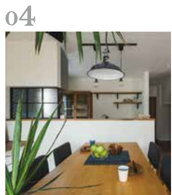
04 ダイニング 家族みんなでカフェみたいなダイニングスペースで食卓を囲み、今日あったことお喋りする特別な時間。